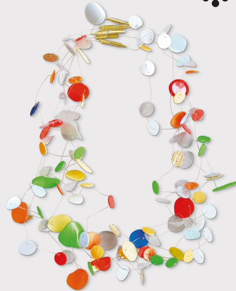
Upcycling-Schmuck Regine Landauer

Auf Instagram wird jede Woche eine neue Auswahl an Schmuckstücken zur Abstimmung freigegeben. Die Objekte, die die höchste Zustimmung erhalten, werden anschließend bei »Abgestimmt – Besucher wählen« ausgestellt. @schmuckmuseum.pforzheim