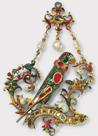
Papagei-Anhänger Süddeutsch, um 1560-70 Schenkung Werner Wild Stiftung Schmuckmuseum Pforzheim