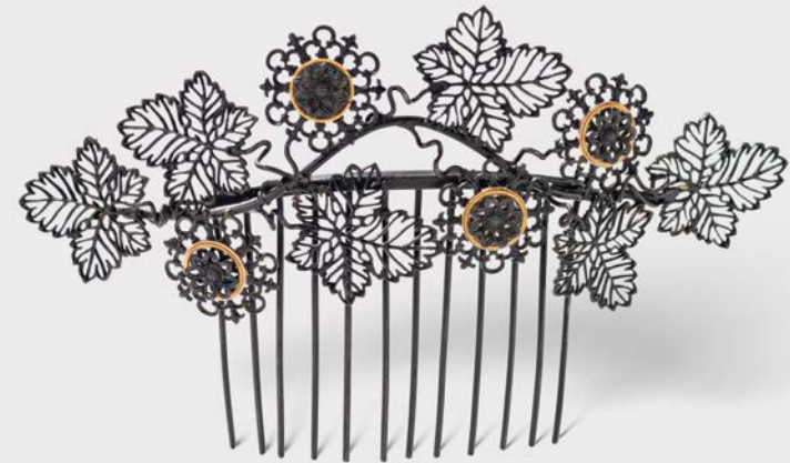
2 Zierkamm-Diadem mit Weinblättern Johann Conrad Geiß Berlin, um 1825/30