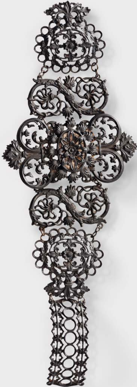
1 Armband Berlin/Gleiwitz, o.J.